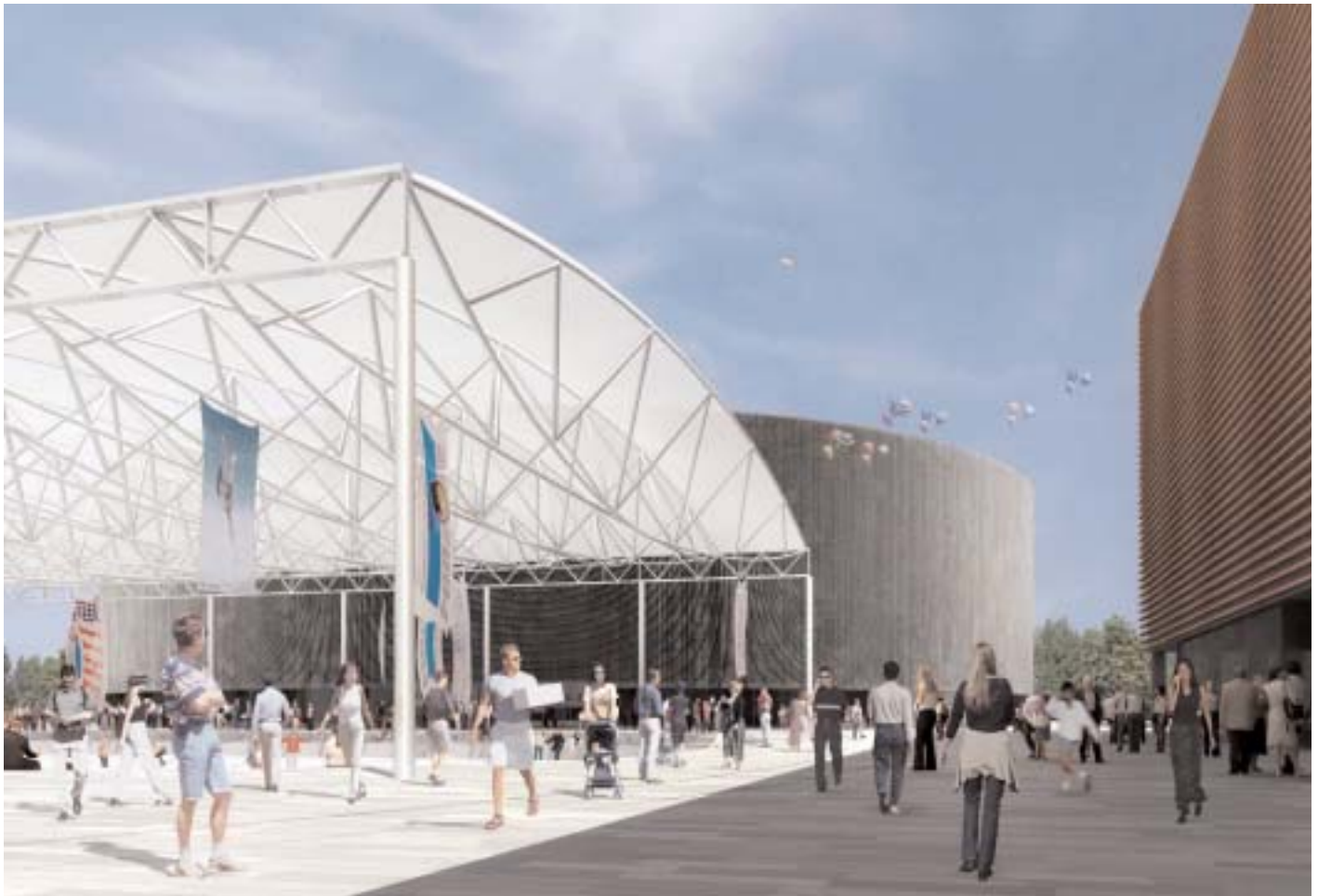
Ansichten «Urbanice» und Stadion

Durch die Südausrichtung der «Living-Wall» haben alle 87 Wohnungen eine attraktive Seesicht.