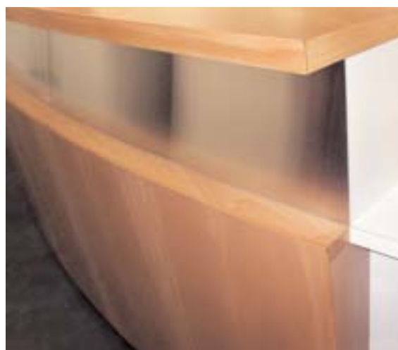
Waschtisch Detail Barabdeckung