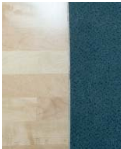
Boden- und Wanddetails